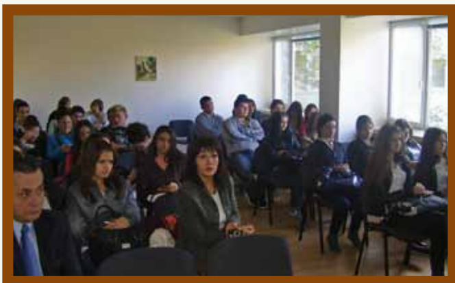
Среща с ученици от Професионална гимназия по икономика „д-р Иван Богоров“ - Варна и студенти от ИУ-Варна

Дните на отворени врати се проведоха и в сградата на РАПИВ, където участниците имаха възможност да се запознаят с условията за инкубиране, материално-техническата база, които БИ-Варна предоставя, както и с добри практики на успешно инкубирани фирми от Високотехнологичен бизнес инкубатор – Варна.